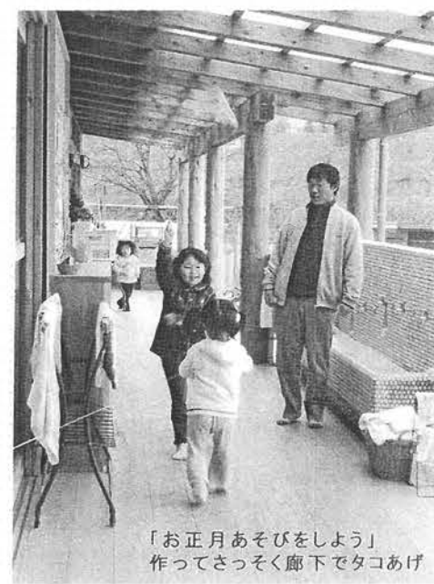
「お正月あそびをしよう」 作ってさっそく廊下でタコあげ

最近1・2歳児の参加が増え、製作などは、低年齢児でも楽しめるように工夫しています。新しい園舎になり、安全にのびのびと活動できるようになりました。